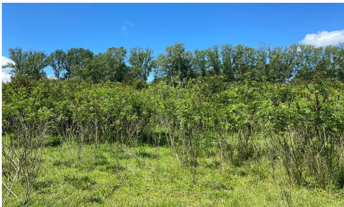
Εικόνα 1. Παρουσία του ξενικού εισβλητικού φυτικού είδους Amorpha fruticosa L στο Δέλτα του Νέστου.

Στην Ελλάδα υπάρχουν αναφορές για την παρουσία του ξενικού εισβλητικού φυτικού είδους Amorpha fruticosa L (Εικόνα 1), στις όχθες του Ποταμού Άρδα (Efthimiou 2017) και στο Δέλτα του Νέστου (Κορακάκη κ.α., 2019). Στο Δέλτα του Νέστου το είδος έχει παρουσία κυρίως σε ανοίγματα εντός του παρόχθιου δάσους (91E0*) και στα κράσπεδα αυτού, όσο και στις περισσότερες ανοικτές περιοχές μεταξύ του αναχώματος και κρασπέδων του ποταμού Νέστου.